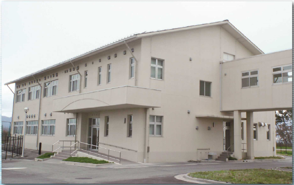
吉川浄水場水質試験棟