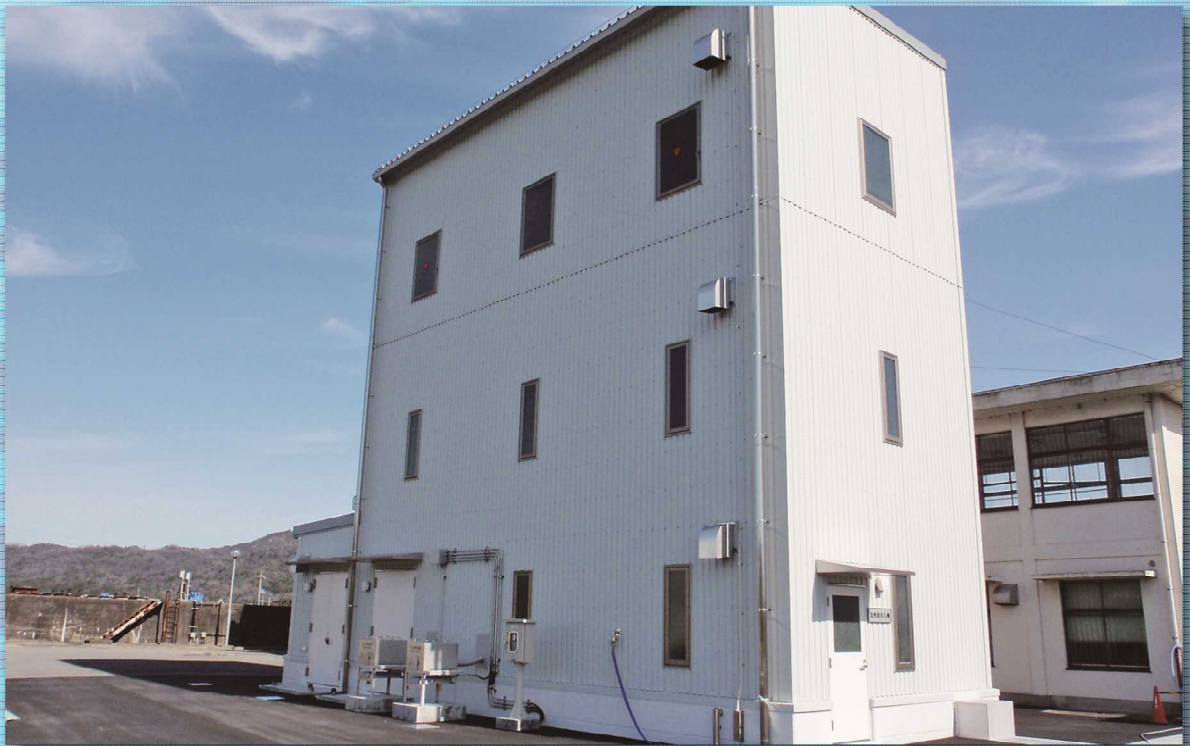
朝国活性炭注入棟