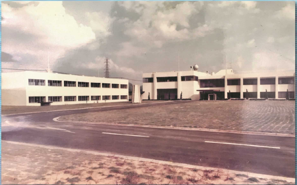
馬渕浄水場中央管理棟