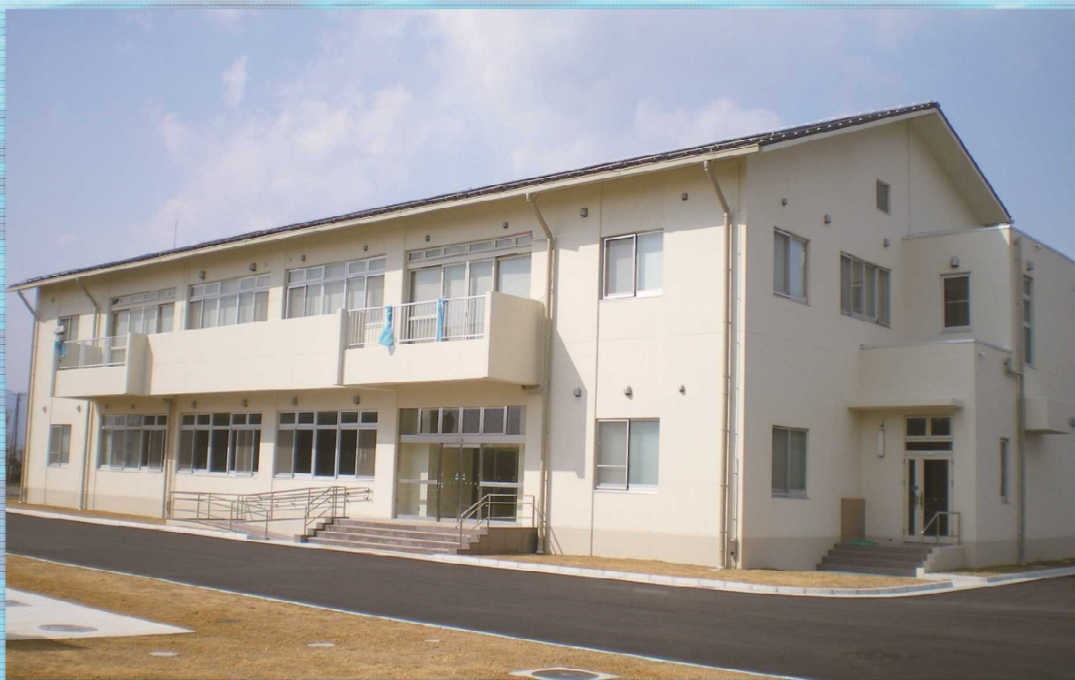
吉川浄水場管理本館