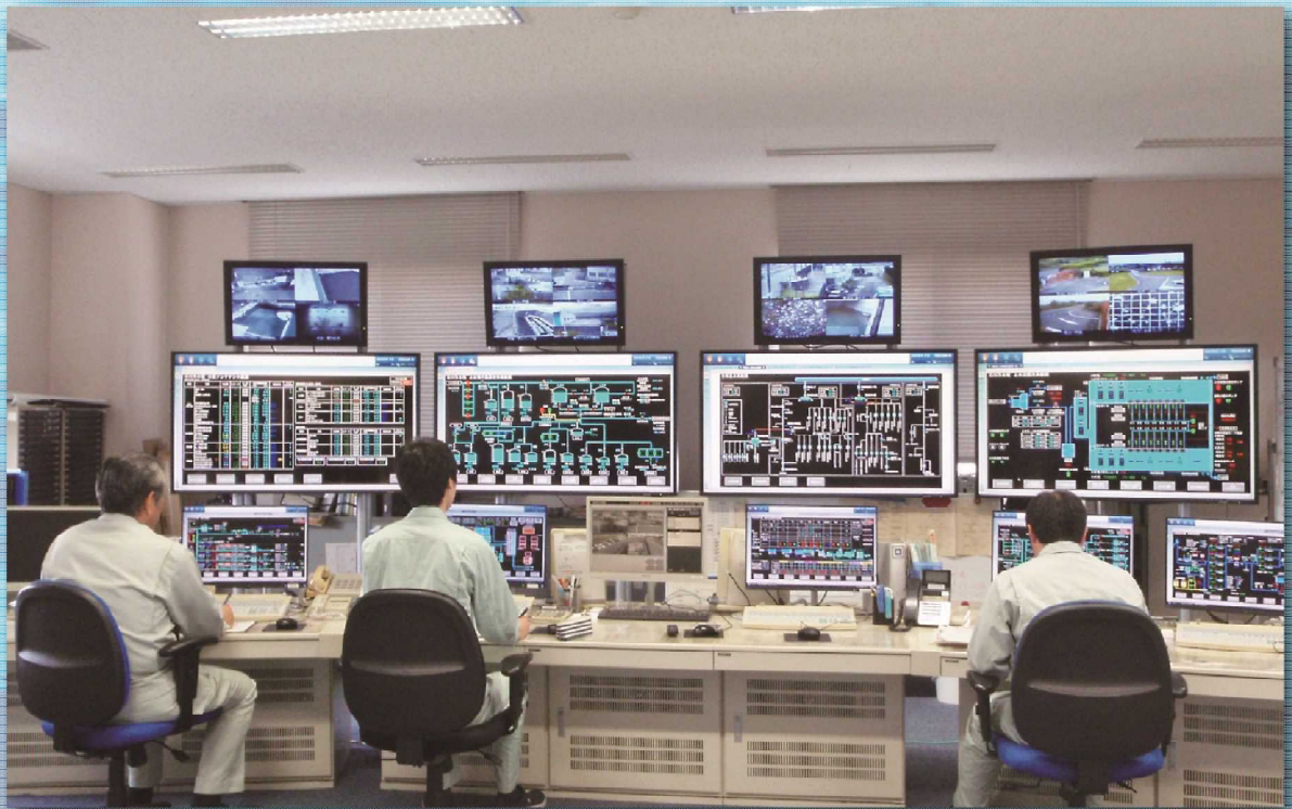
集中監視制御システム