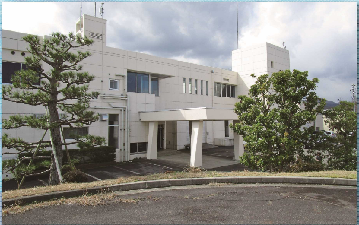
水口浄水場中央管理棟