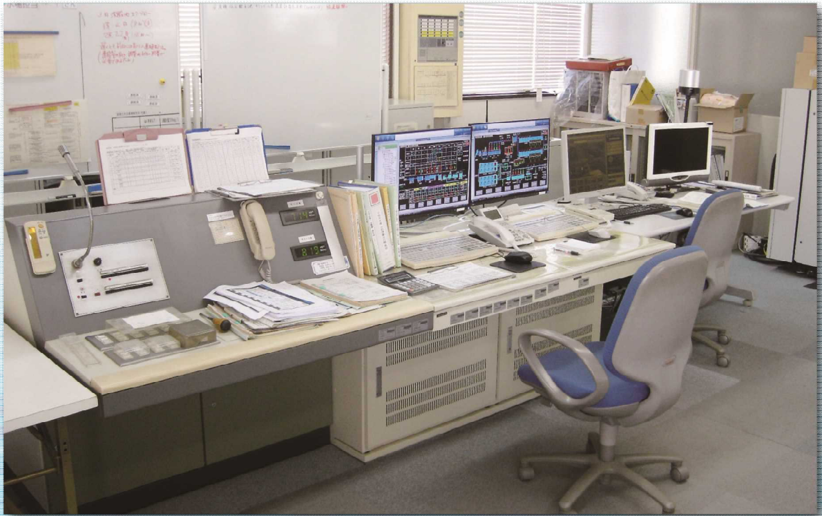
馬淵浄水場中央監視システム