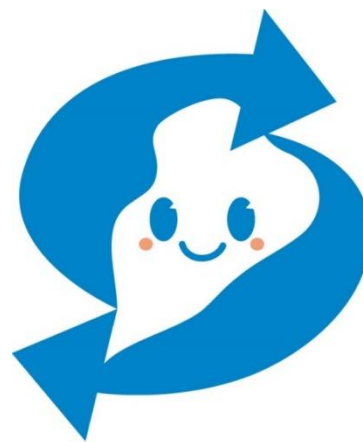
ビワクルエコ製品

※ 滋賀県リサイクル製品認定制度は、リサイクル製品のうち、循環資源の適正な循環的利用の促進および環境への負荷の低減に資するものを滋賀県リサイクル認定製品として認定するものです。