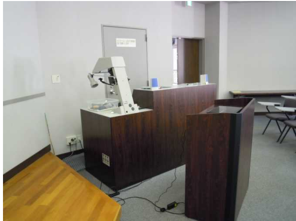
セミナールーム名表示場所