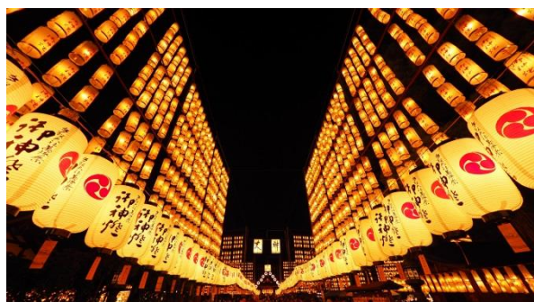
↑ 多賀大社 万灯祭