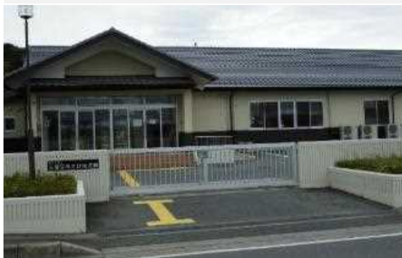
五個荘あさひ幼稚園140名