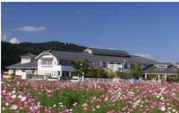
さくらんぼ幼稚園 212名