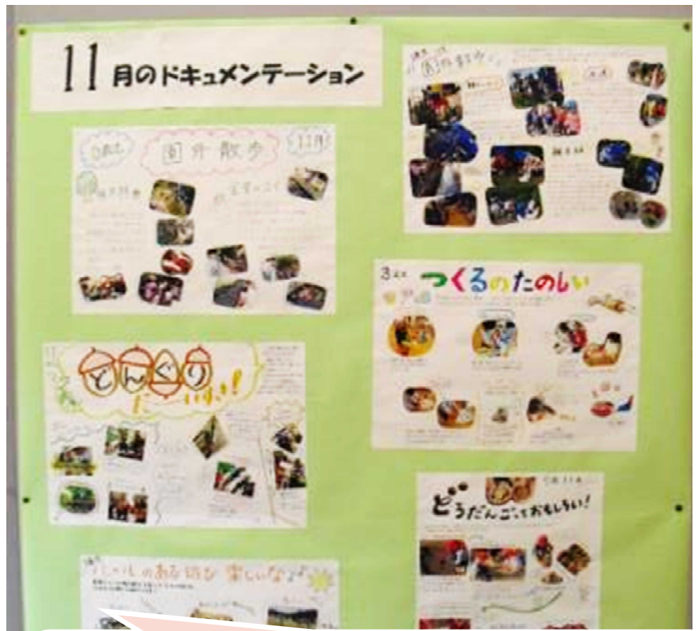
「遊び＝学び」の様子を伝える 幼稚園のドキュメンテーション