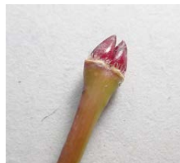
イロハモミジの冬芽

みなさんが育てている苗木や周りの木々は、どのような冬芽をつけているでしょうか。ぜひ観察してみてください。