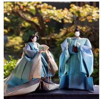
清輝雛/雛匠 東之湖作