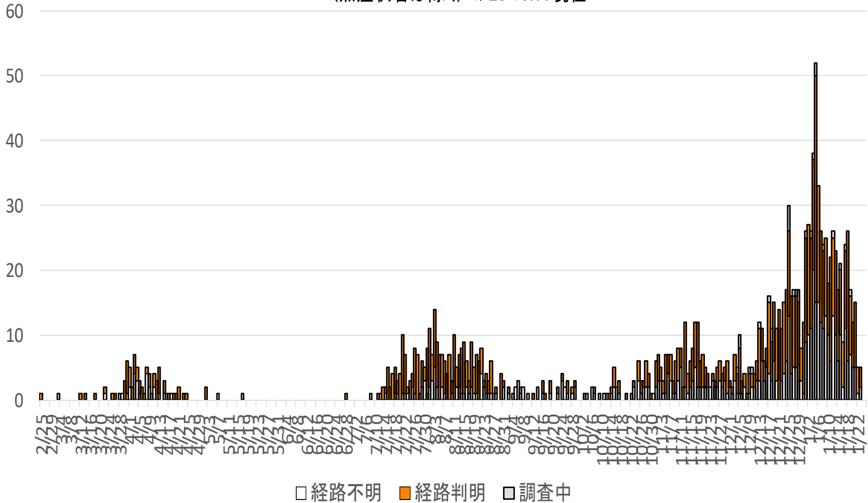
新型コロナウイルス感染症の流行曲線（発症日別） （無症状者は除く）1/25 19:00現在