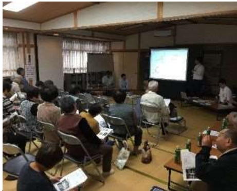
平成29年10月 出前講座