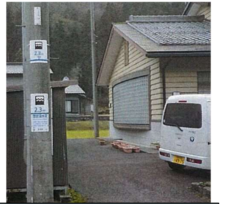
平成31年3月 まるまち看板