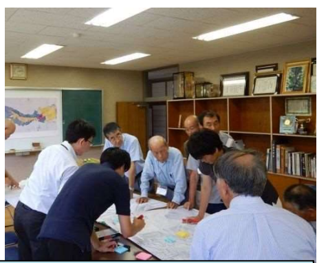
平成28年8月 水害履歴調査