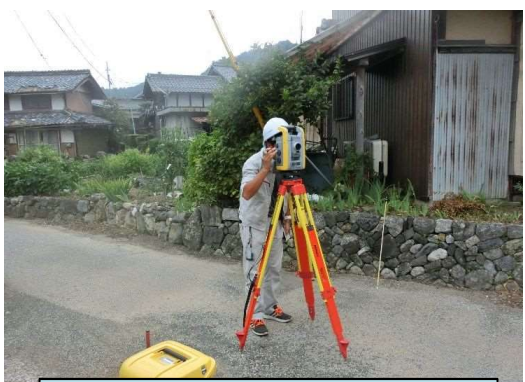
平成29年12月 既存住宅調査