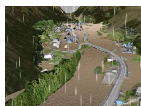
平成30年11月 浸水3Dアニメーション