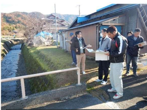
平成29年12月 まちあるき