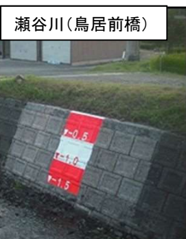
瀬谷川(鳥居前橋) 平成30年 簡易量水標設置