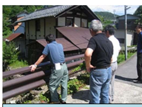
平成30年6月 簡易量水標設置協議