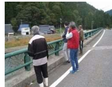
平成30年10月 まちあるき