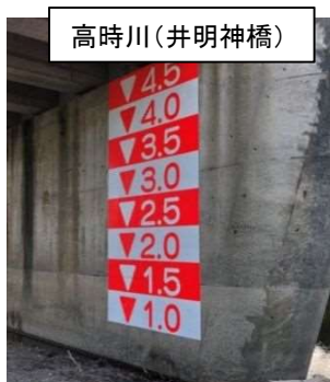
高時川(井明神橋) 平成30年 簡易量水標設置