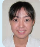
と な り さ 十名 理紗