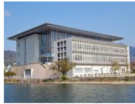
琵琶湖環境科学研究センター

令和2年度からは、第六期中期計画に基づき、「琵琶湖をとりまく環境の保全再生と自然の恵みの活用」「環境リスク低減による安全・安心の確保」、「気候変動に適応した豊かさを実感できる持続可能な社会の構築」に向けて試験研究を推進しています。