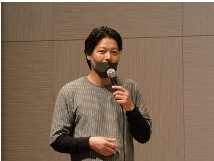
俳優の柴田善行さんもトークショーに飛び入り参加