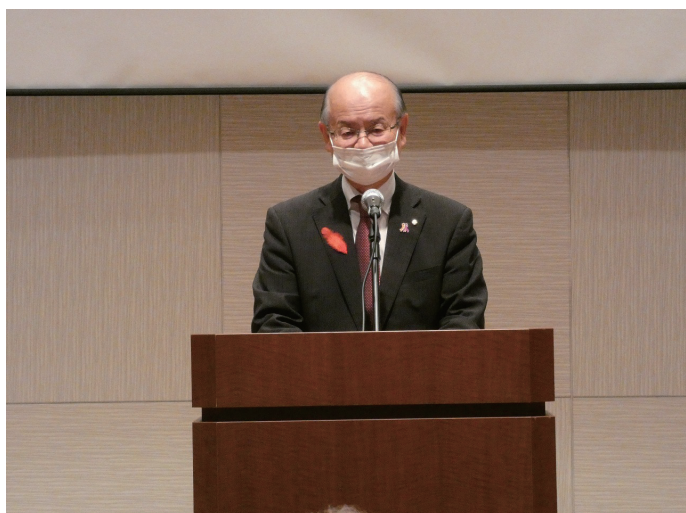
橋川渉草津市長よりご祝辞をいただきました