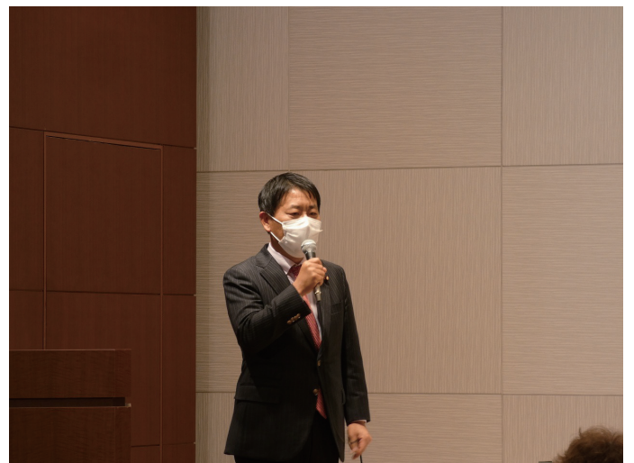
武村展英衆議院議員に締めのご挨拶をいただきました