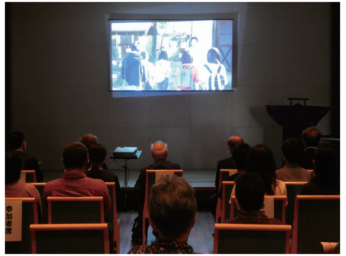
撮影の様子を収録したメイキングもご覧いただきました