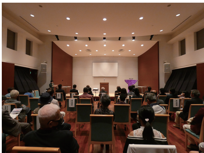
上映会には約 60 名のお客様にご来場いただきました