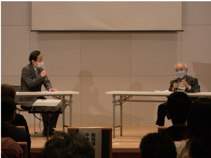
中島貞夫監督によるトークショーです