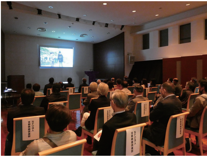
子ども達の熱演をご覧いただきました