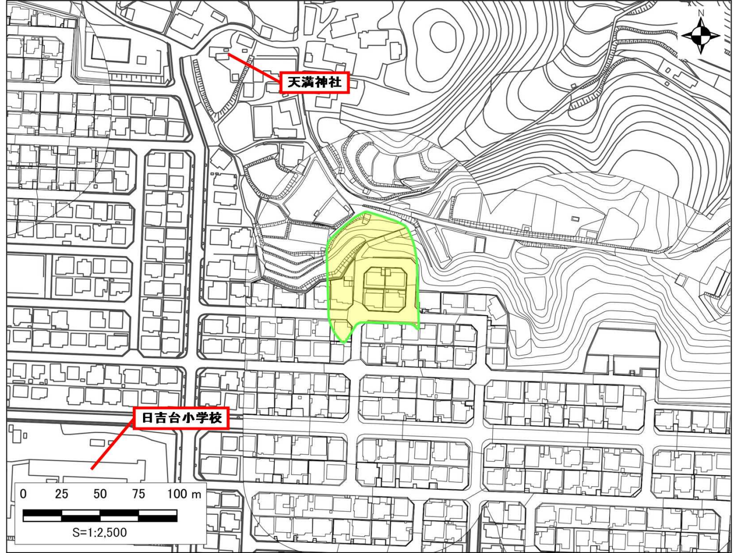
土砂災害警戒区域・土砂災害特別警戒区域 区域図

○ この区域図は、空中写真測量による地形図に、実測による区域図を投影したものであり、一部異なって見える場合があります。詳しくは、土木事務所にお尋ねください。