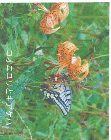
コヤネコリとキアゲハ