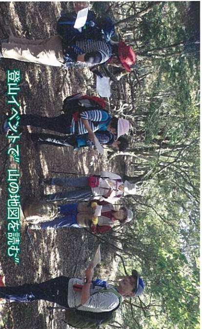
登山イベントで“山の地図を読む”