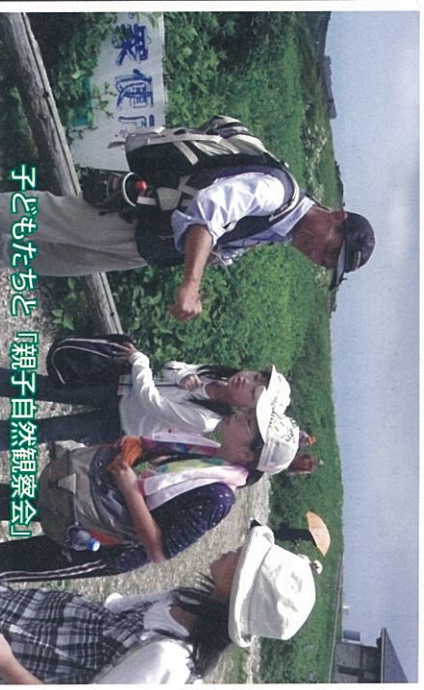
子どもたち「親子自然観察会」