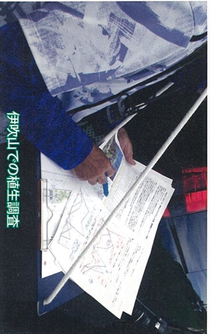
伊吹山での植生調査