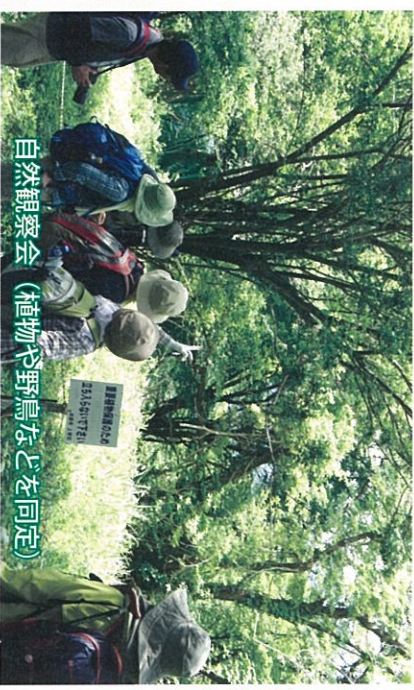
自然観察会（植物や野鳥などを同定）