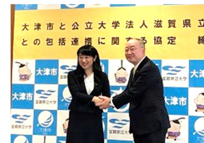
[ 大津市との包括連携協定締結式 ]

地元経済界や自治体等との連携・協力を進め、彦根市をはじめとする県内自治体とも連携協定を締結してきたが、平成31年1月に、自治体としては12団体目となる大津市と包括連携協定を締結した。この協定では、SDGsの普及、環境保全や県内雇用の推進、人材育成、地域活性化、文化振興、学校教育・生涯学習等を連携事項とし、協定締結式に併せて大津市長と学長による意見交換を実施したほか、3月16日に開催したSDGs学生大会のパネルディスカッションに大津市長が登壇するなど、具体的な取組を進めた。