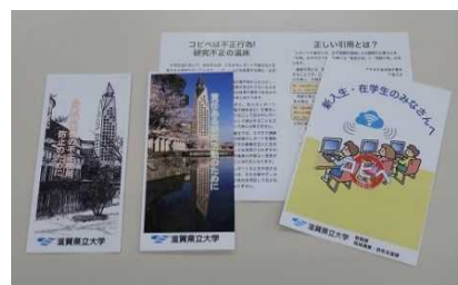
[ 研究倫理教育リーフレット ]

さらに、研究活動上の不正行為防止計画に基づく取組の一つとして、学生への研究倫理教育および情報倫理教育のためのリーフレットを作成し、新入生に配付することとした。