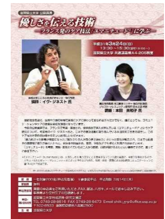
[ 公開講演チラシ ]