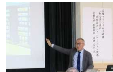
[ 広報マインド向上研修 ]

また、事務局の職員構成として、法人職員の人数が県派遣職員を上回るようになる中で、法人職員の資質向上・能力開発を総合的に推進できるよう、法人職員人材育成方針の見直しを行った。見直しにあたっては、事務局法人職員を対象に人材育成・研修制度等に関するアンケート調査を実施し、この結果等を踏まえて、平成 31 年 3 月に法人職員人材育成方針を改定した。新たな人材育成方針では、キャリアパスと研修を組み合わせ、計画的なジョブローテーションと多様な研修制度の整備を図ることとしたほか、求められる職員像や職階ごとの能力、キャリアパスモデルのイメージなどを具体的に示した。