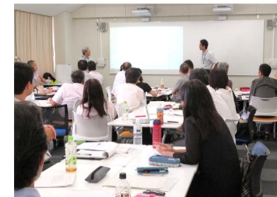
[ アクティブラーニング研修 ]

教育環境の整備としては、多様な授業形態に対応できるよう、平成29年度に改修した1室に加え、新たに講義室1室をアクティブラーニング対応仕様に改修し、電子黒板、複数のホワイトボード等を設置した。平成30年度後期授業から供用を開始し、併せて「学生を授業に参加させる秘訣」をテーマとしたアクティブラーニング研修を実施したことなどにより、ディベートやグループワークなどの授業形式がさらに浸透し、改修した講義室の稼働率も向上した。この研修は、FD活動の一環として、関西地区FD連絡協議会との共催により実施したが、他大学の教員からも好評で、本学における授業改善活動のレベルの高さを確認する機会となった。