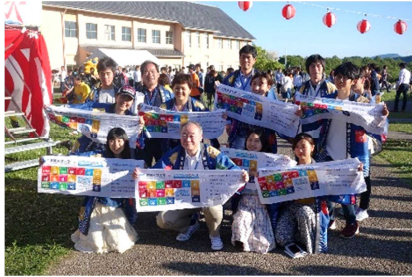
[ 湖風夏祭でのSDGs宣言 ]

学長と学生が「滋賀県立大学SDGs宣言」を実施したほか、県大SDGsアンバサダー事業として、SDGsの先進的な活動を行う大学に学生を派遣し、学生団体等の取材や意見交換を行うなど、交流を図った。