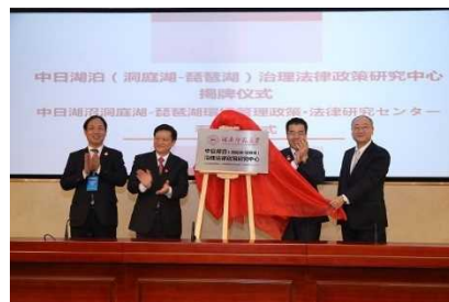
[ 中日湖沼洞庭湖-琵琶湖環境管理政策・法律研究センター除幕式 ]

また、アジア圏の研究機関と連携して、湖沼流域管理に関する政策・社会科学分野における共同研究等を推進するため、環境科学部の附属施設として「湖沼流域管理研究センター」を平成30年11月に設置した。このセンターでは、中国湖南省に設立された「中日湖沼洞庭湖-琵琶湖環境管理政策・法律研究センター」との間で、研究者や学生の相互交流を図りながら共同研究や人材育成を進めることとし、中国湖南省で11月13日に行われた除幕式に、理事長および環境科学部長(湖沼流域管理研究センター長)が滋賀県知事とともに出席したほか、「研究コミュニティ形成促進費」を活用して、関係機関等と連携した研究会を実施するなど、研究コミュニティの形成を進めた。