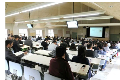
[ コンプライアンス研修 ]

コンプライアンス研修として、SNS 利用によるリスクをテーマに、SNS に関する基本的な知識をはじめ、炎上事例やトラブル防止の対策などについて、実例を交えた研修を実施した。効果的な研修とするため、管理監督者向けと一般教職員向けの 2 回に分け、求められる役割や習得すべき知識等に応じた研修内容にするとともに、研修参加率 100% を目指して、一般教職員向けは全学休講日の開催として積極的な参加を呼び掛けたほか、事務局においては、欠席者に対する伝達研修を行った。