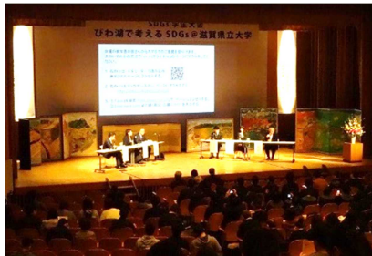
(パネルディスカッション)

平成31年3月16日には「びわ湖で考えるSDGs」と題したSDGs学生大会を開催し、知事による基調講演、知事・大津市長を交えたパネルディスカッションのほか、学生団体等の活動を紹介するポスターセッション、学生活動が抱える課題の解決策や新たな展開等をディスカッション形式で話し合うワークショップなどを実施した。県外を含む17大学、10高校、1中学校、1小学校をはじめとして、学生を中心に359名の参加があり、活発な意見交換と交流が行われた。