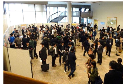
(ポスターセッション)