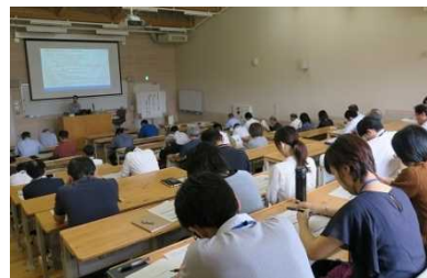
[ FD・SD 研修会 ]

FD・SD 研修会として、「SDGs と大学キャンパス」をテーマに、大学における SDGs 関連の取組の実例や可能性に関する研修を実施したほか、戦略的な広報に取り組みされている近畿大学から講師を招いた「知と汗と涙の近大流コミュニケーション戦略」をテーマとした広報マインド向上研修、留学生交流推進会議での「大学におけるグローバル人材育成とは」をテーマとした講演、PROG デストの分析結果を解説する研修など、多様な研修機会を設けた。