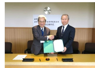
[ 滋賀県私立中学高等学校連合会との連携協定締結式 ]

また、高大連携事業の充実に向け、平成30年5月に滋賀県私立中学高等学校連合会と連携協定を締結した。これを受け、これまで県の教育委員会との共催により実施してきた大学連携講座を、県内の私立高等学校を加えた形で実施し、新たに40名の生徒の参加を得た。