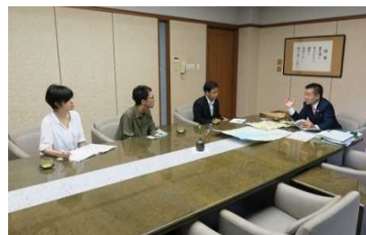
[ 知事インタビューの様子 ]

また、全学的な広報推進体制を強化するため、教職員を対象とした広報マインド向上研修を 12 月に実施したほか、広報連絡員会議の開催、学内向けの広報ニュースレターの配信などにより、広報マインドの向上を図るとともに、広報連絡員等が連携して広報素材の掘り起こしに努め、新たに大学講座情報を新聞社に提供するなど、