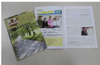
[ 「県大 jiman」第 24 号 ]

学生スタッフが主体となって企画・編集等を行っている大学広報誌「県大 jiman」では、平成 31 年 2 月に発行した第 24 号において、三日月大造滋賀県知事へのインタビューを行い、SDG s の取組や学生活動に対する考えなどについて、対談形式の特集を掲載した。この特集では、本学の「近江楽座」などの活動にも触れつつ、SDG s の理念や取組などについて、学生等に向けて発信した。