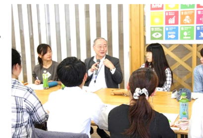
[ 学長と学生との意見交換 ]

SDGsにかかる取組の実施にあたり、学生の視点からの意見や提案などを聴き、事業に反映させるため、学長と学生を交えた意見交換を行い、平成30年6月16日の「湖風夏祭」において、