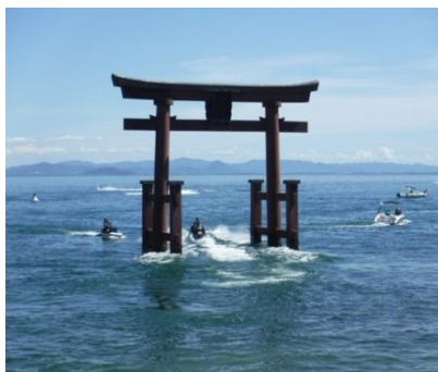
白鬚神社湖中大鳥居(高島市)