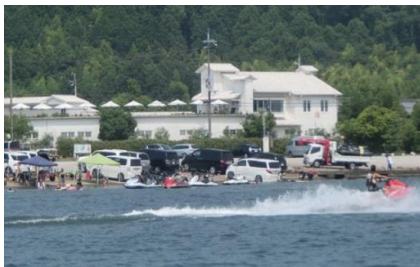
矢倉川河口部スロープ(彦根市)

全体として、苦情件数は条例制定当初と比較して大きく減少しているものの、矢倉川河口部スロープや白鬚神社のように地域によって異なる課題が見られるようになってきており、地域ごとの事情を考慮し、関係者と連携しながら対応していくことが必要となっています。