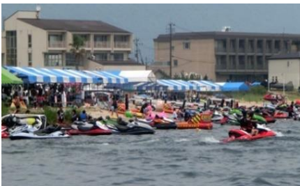
近江舞子・北比良(大津市)