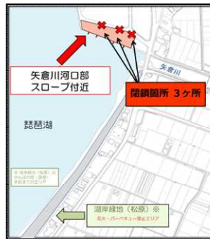
湖岸緑地松原～矢倉川河口部スロープ付近一帯地図

告知 湖岸緑地松原・矢倉川河口部スロープ付近帯の利用者のみなさまへ 近隣住民や他の利用者の危険・迷惑となる行為(早朝からの騒音、バーベキュー、ゴミの放置、路上駐車等)が多発していることから、来る 8月1日 ～ 9月30日 までの期間、左記の場所への車両乗り入れができませんよう、入口を閉鎖します。 滋賀県 彦根市 湖岸緑地(松原) ※ 観光・バーベキュー禁止エリア 彦根市 観光企画課・生活環境課・交通管理課