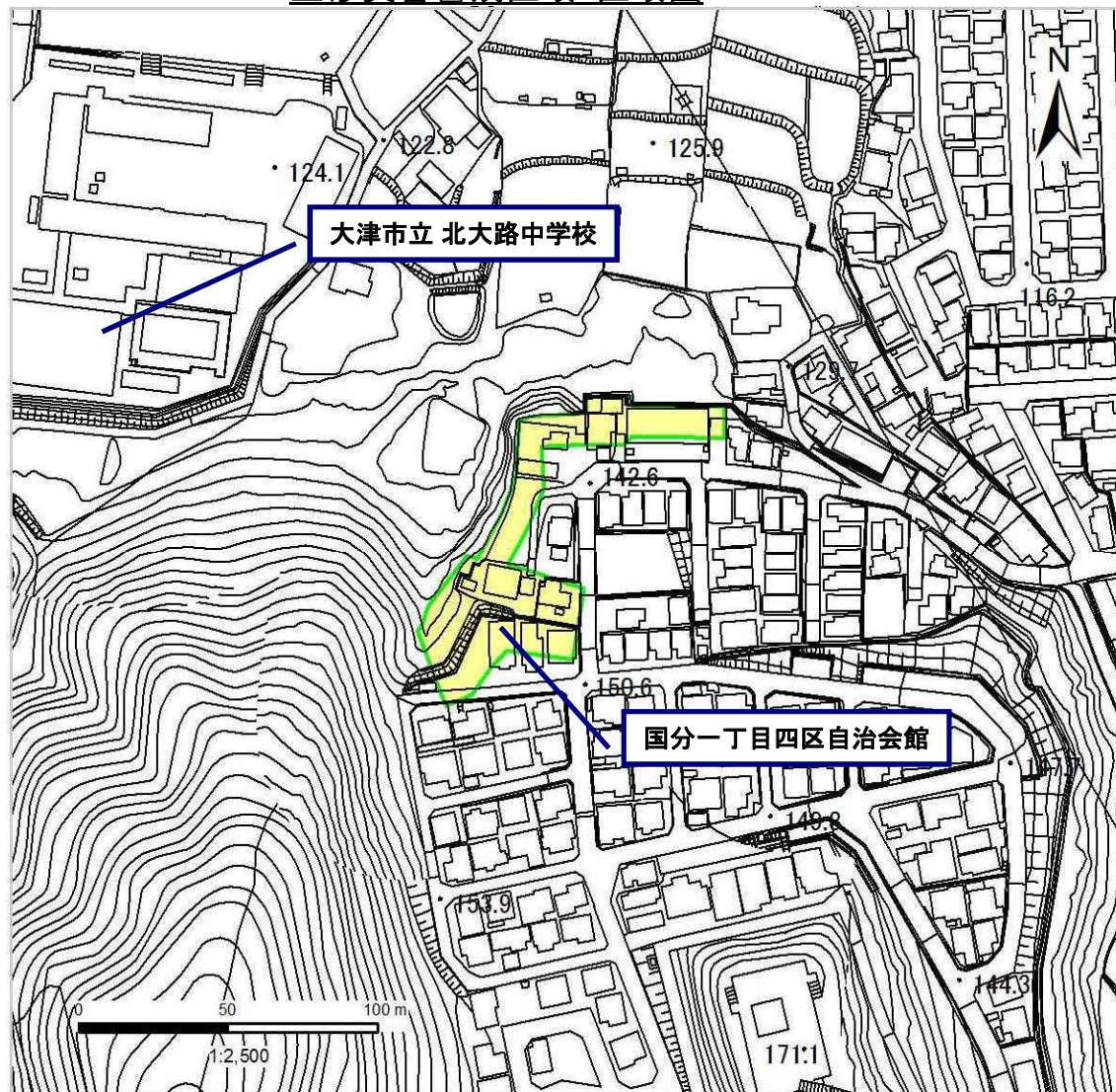
土砂災害警戒区域・区域図

○ この区域図は、空中写真測量による地形図に、実測による区域図を投影したものであり、一部異なって見える場合があります。 詳しくは、土木事務所にお尋ねください。