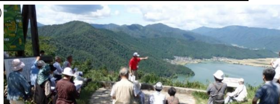
↑ 賤ヶ岳でのガイドの様子