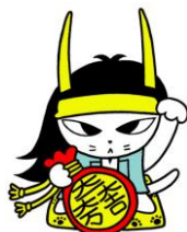
いしだみつにゃん