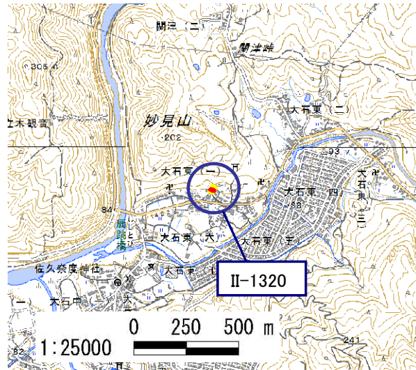
土砂災害警戒区域・土砂災害特別警戒区域 位置図

この地図は、国土地理院長の承認を得て、同院発行の電子地形図 25000を複製したものである。(承認番号 平28情複、第1479号)