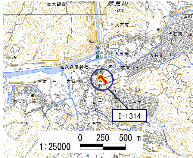
土砂災害警戒区域・土砂災害特別警戒区域 位置図

・この地図は、国土地理院長の承認を得て、同院発行の電子地形図 25000を複製したものである。(承認番号 平28情複、第1479号)