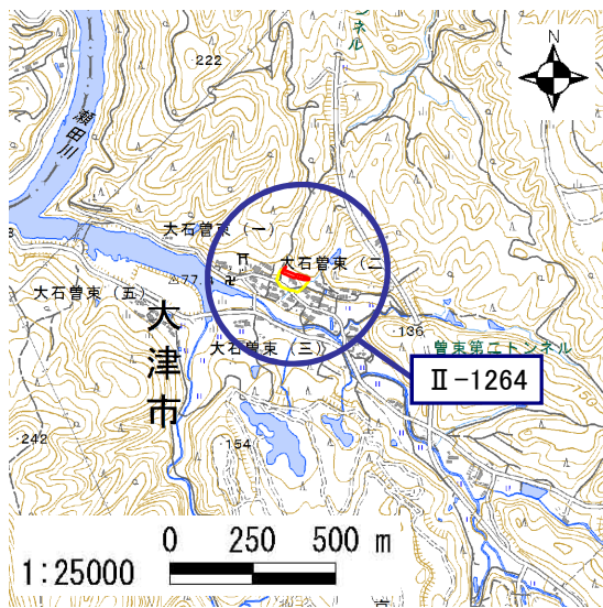
土砂災害警戒区域・土砂災害特別警戒区域 位置図

この地図は、国土地理院長の承認を得て、同院発行の電子地形図25000を複製したものである。(承認番号 平28情複、第1231号)