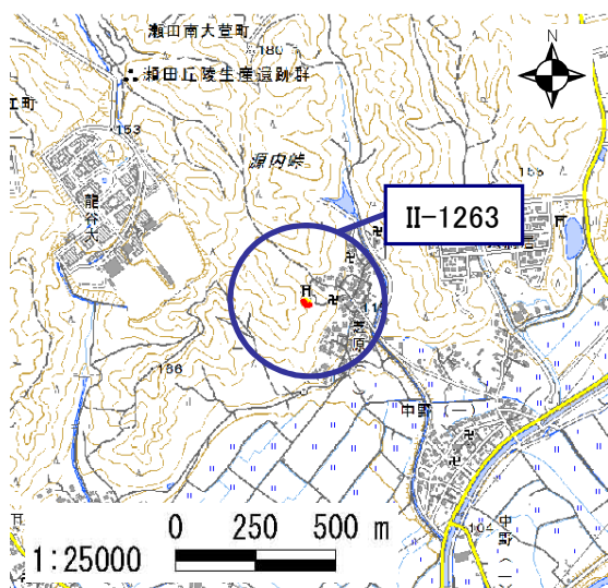
土砂災害警戒区域・土砂災害特別警戒区域 位置図

・この地図は、国土地理院長の承認を得て、同院発行の電子地形図 25000を複製したものである。(承認番号 平28情複、第1081号)