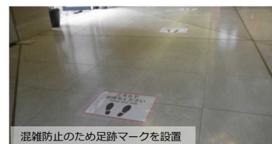
混雑防止のため足跡マークを設置