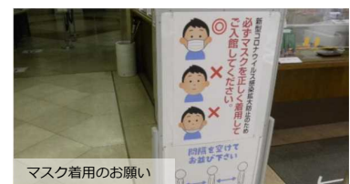
マスク着用をお願い