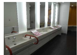
イオンモール草津 トイレの手洗いの間引きおよびジェットタオルの使用禁止