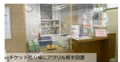
チケット売り場にアクリル板を設置