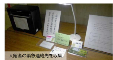
入館者の緊急連絡先を収集