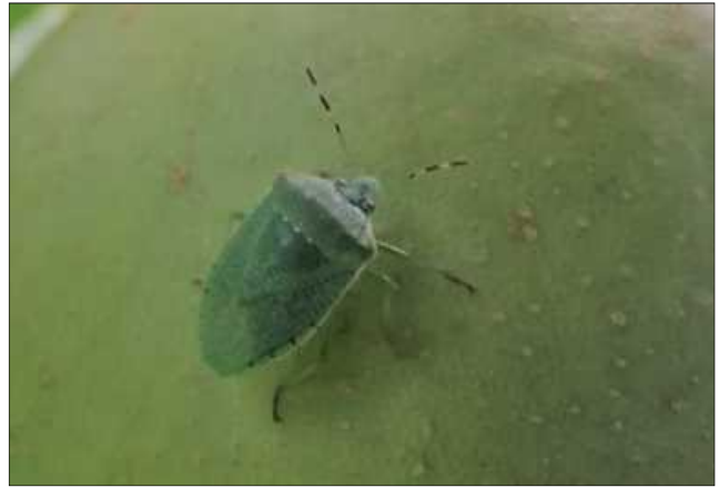
写真 チャバネアオカメムシ（左）とツヤアオカメムシ（右）