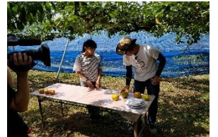
R1 県広報番組収録風景

滋賀県は若いみなさんの視点を求めています。 青少年広報レンジャーになって、様々な現場を体験・レポートしてみませんか? 活動を通じたみなさんの声が“明日のしが”を創ります!