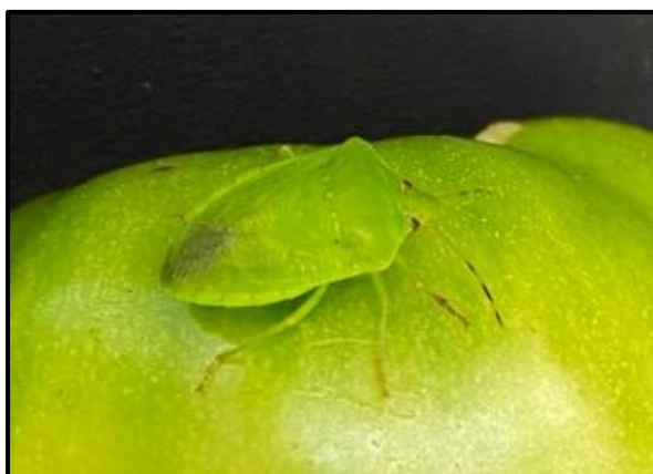
ミナミアオカメムシ