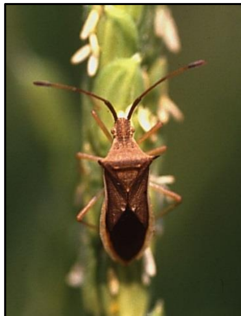
ホソハリカメムシ