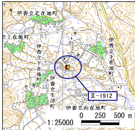
土砂災害警戒区域・土砂災害特別警戒区域 位置図

・この地図は、国土地理院長の承認を得て、同院発行の数値地図25000(地図画像)を複製したものである。 (承認番号 平16総複、第205号)