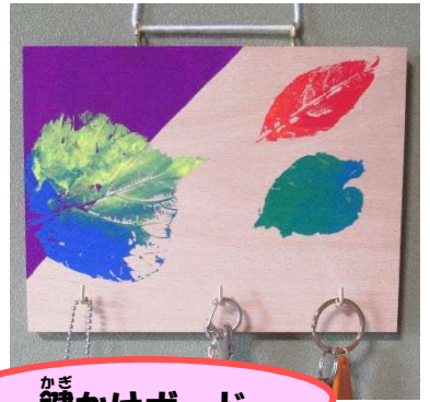
かぎ 鍵かけボード