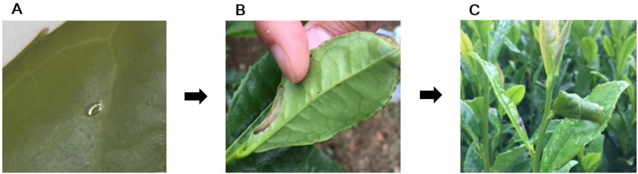
図1 異なる発育ステージのチャノホソガによるチャの被害 (A) 産卵期 (B) 葉縁潜行期 (C) 巻葉初期