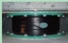
積層ゴムアイソレータ