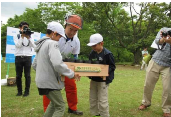
▲「苗木のスクールステイ」の苗木の手渡し

令和として改元を迎えた今年、全国植樹祭に使う苗木を県内の小学校で育てていただく「苗木のスクールステイ」をはじめました。この取組では、県内の小学4年生を対象に実施している森林環境学習「やまのこ」の中で苗木を育ててもらうことで、子どもたちに全国植樹祭に関心を持っていただき、びわ湖と森のつながりの大切さなどを伝えていきます。小学校の皆さん、楽しく学びながら、苗木のお世話をどうぞよろしくお願いいたします。