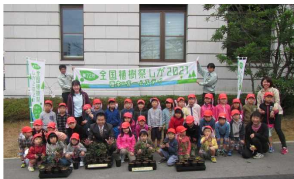
▲「大津市立朝日が丘保育園」の皆さん