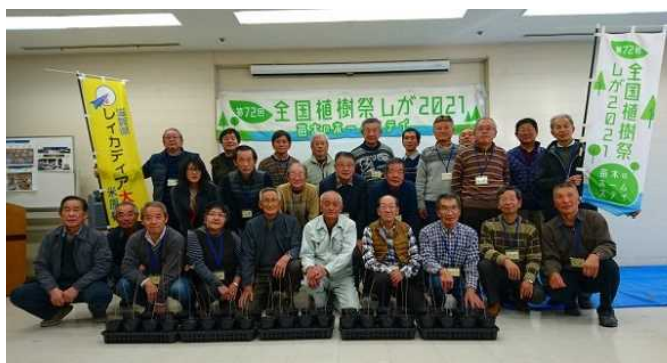
▲「滋賀県レイカディア大学（米原校）」の皆さん

令和3年の春に開催される「第72回全国植樹祭」に向けて、一般のご家庭や企業・団体の皆さんに苗木を育てていただく「苗木のホームステイ」。平成30年度は、個人の方90件、企業・団体49件の皆さんに3598本の苗木を育てていただいています。大切に育てていただいた苗木は、当日の植樹行事に利用させていただきますので、引き続き、苗木のお世話をどうぞよろしくお願いいたします。