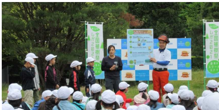
▲「やまのこ」で、先生と三日月知事より「苗木のスクールステイ」を説明