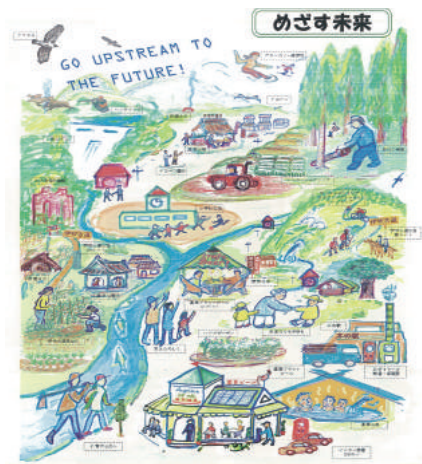
(伊吹くらしのやくそう倶楽部のめざす未来)

伊吹くらしのやくそう倶楽部では一緒に活動してくれるパートナー団体を探している。現在活動しているのは草刈や水路の清掃などの棚田の保全作業、収穫体験、味噌作り、しめ縄作りなどの田舎暮らし体験と様々。これに加え、棚田薬草・ハーブ植物園をつくっていき、在来種の染料作物であるイブキカリヤス、ニホンアカネの栽培も進めているそう。今後は薬草を使ったクラフトビールの商品化や、イブキカリヤスなどの染料体験によるグリーンツーリズムなどにチャレンジする。このような活動を通じ、訪れる人や地域に暮らす若者が増え、子供からお年寄りまで、人々の笑顔がいっぱいの伊吹地域になることを願っている。多種多様な活動があるので、この地域に携わる方それぞれにやりたいうことが実現できる地域である。外部からの視点のアドバイスも希望しているので、作業だけでなく、この地域をどう次世代につないでいくかと一緒に知恵を絞ってくれる団体も募集している。協働作業することで、活動の点が線となり未来へ繋がっていくことに期待したい。