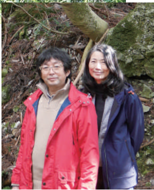
「伊吹くらしのやくそう倶楽部」