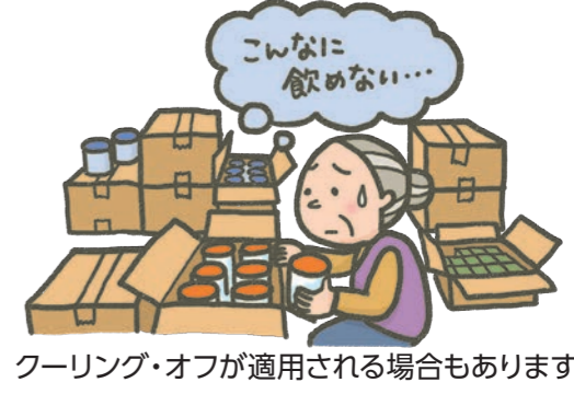
クーリング・オフが適用される場合もあります。