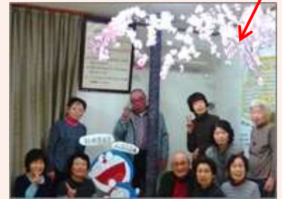
共同制作した桜の花