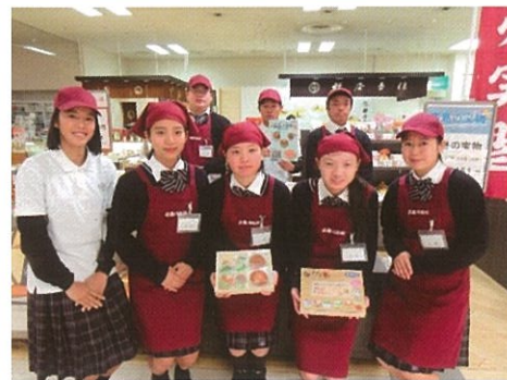
自ら企画開発した商品で販売実習