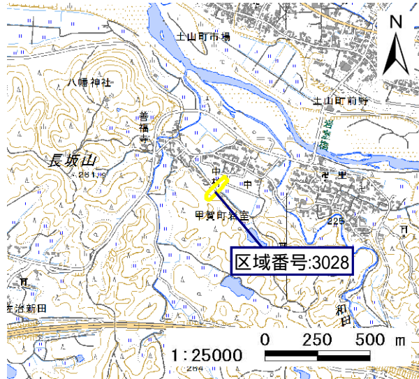
土砂災害警戒区域・土砂災害特別警戒区域 位置図

この地図は、国土地理院発行の数値地図25000(地図画像)を複製したものである。