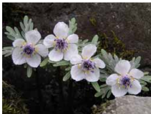
セツブンソウ