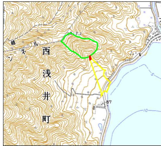
土砂災害警戒区域・土砂災害特別警戒区域 位置図