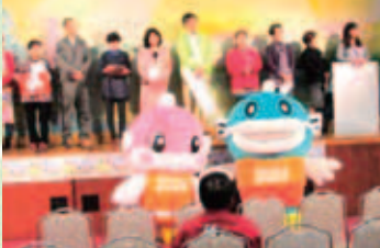
参加団体が活動をPR！ キャッフィー＆チャッフィーも登場！

平成29年12月3日、恒例の「G-NETしがフェスタ」が開催されました。今年は、家庭や地域、そして世代を越えた心のつながりが感じられる場にしたいという実行委員一同の願いから、「伝える 伝わる 響き合う」がテーマに設定されました。当日は、「男女の自立と共同参画」のアピールのほか、どの世代も楽しめるコーナーが多く企画され、様々な出会いと気づき、つながりが生まれる一日になりました。