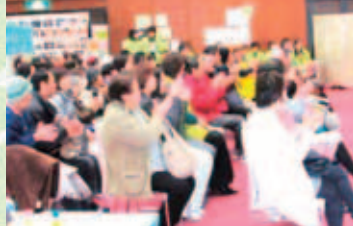
多くの方が会場にお越しくださいました