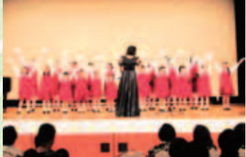
★クロージング：合唱コンサート（スマッシュ）