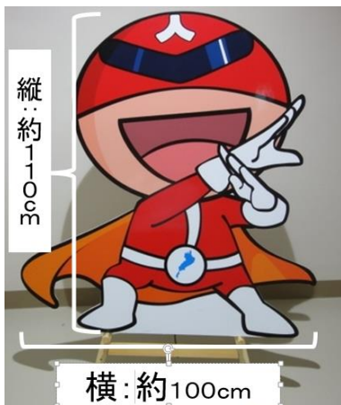
ジンケンダーボード ・イーゼル