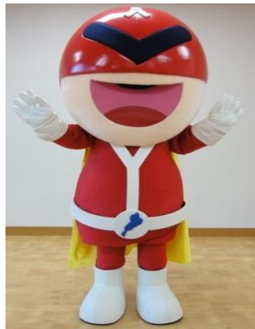
ジンケンダー着ぐるみ