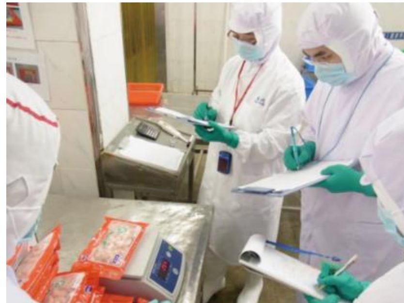
日本生協連による 製品重量点検