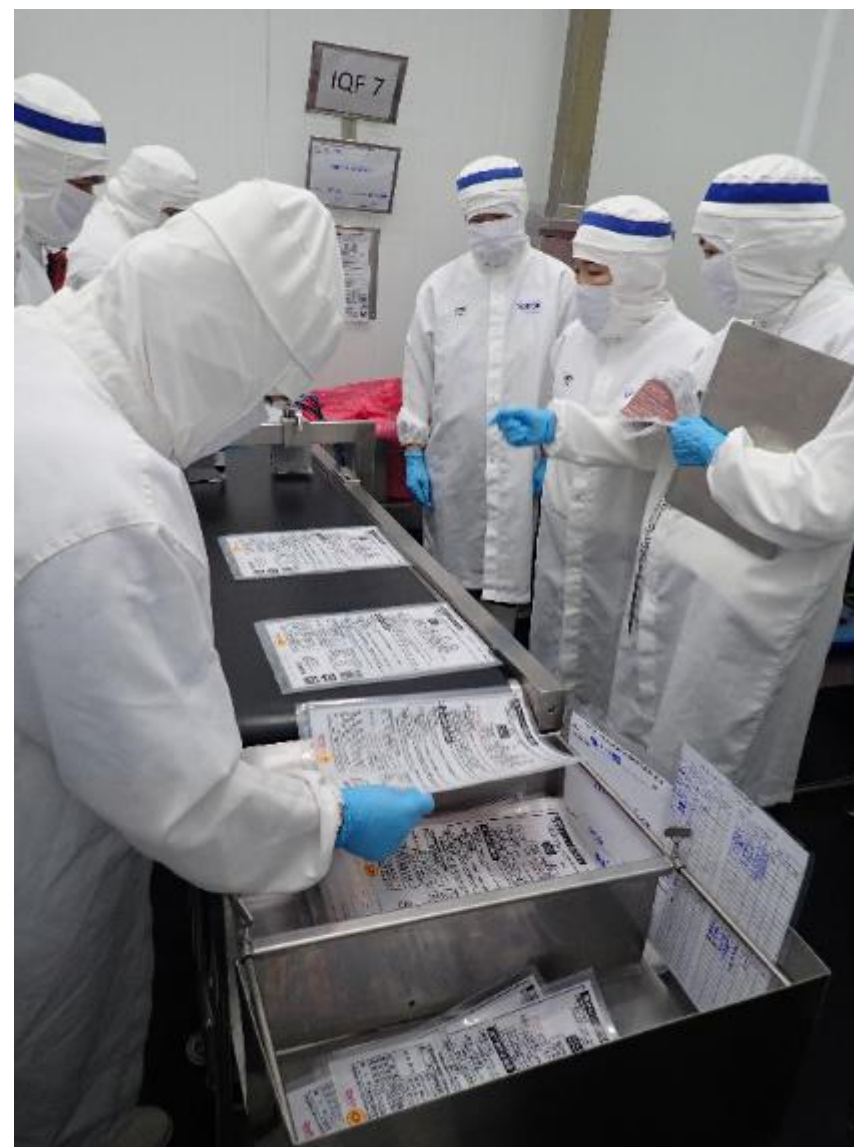
タイ 食品工場(チキン製品) の包材印字の点検