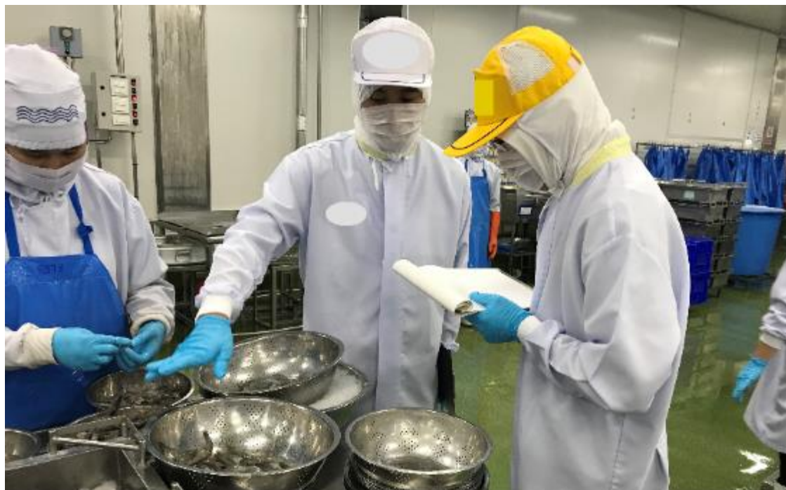
タイ 食品工場(エビ)の選別