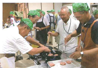
長年にわたって蓄積されたレシピファイル!

男性たちはストレスから解放され、心から料理や趣味の人生を楽しんでいるようでした。