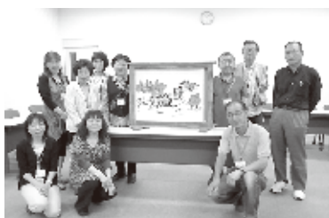
第4期東近江市男女共同参画リポーター(11名)

市内自治会の方針決定や企画運営についての調査(H19年7月実施)や、市内の高校生向けにアンケートを実施した結果をもとに、子どもの虐待、DV、リボン運動、新しい家族のカたち等について、身近な話題から問題提起と解決に向け啓発しています。参加者の感想は身近な話題でわかりやすいと好評を得ています。