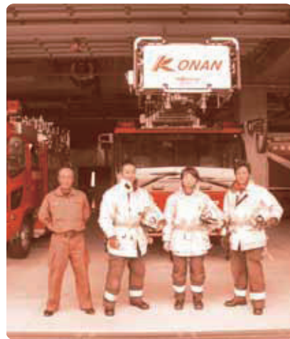
“人の命を守る”北署で活躍する男女混合チーム

「人の命を救いたい」この一念から消防の世界に入った女性達、恋も出産もし、24時間体制3交代という勤務の中で、自分の夢を叶え、活躍されている姿を見たとき、私達の心も希望でふくらみました。