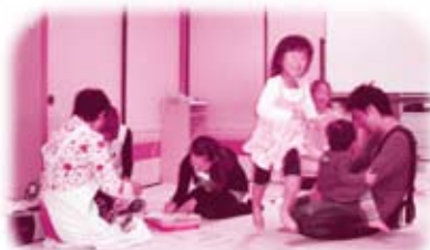
◀講座中も託児があれば 安心です!