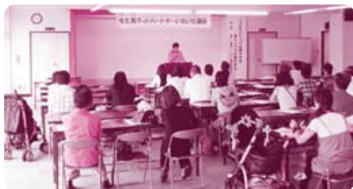
▲子育て中のママ・パパも いっしょに参加♪(いきいき講座)