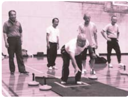
▲(ニュースポーツ) ユニカール