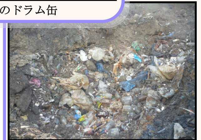
A区画の医療系廃棄物