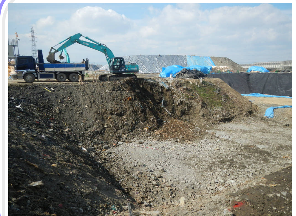
東側焼却炉跡の状況